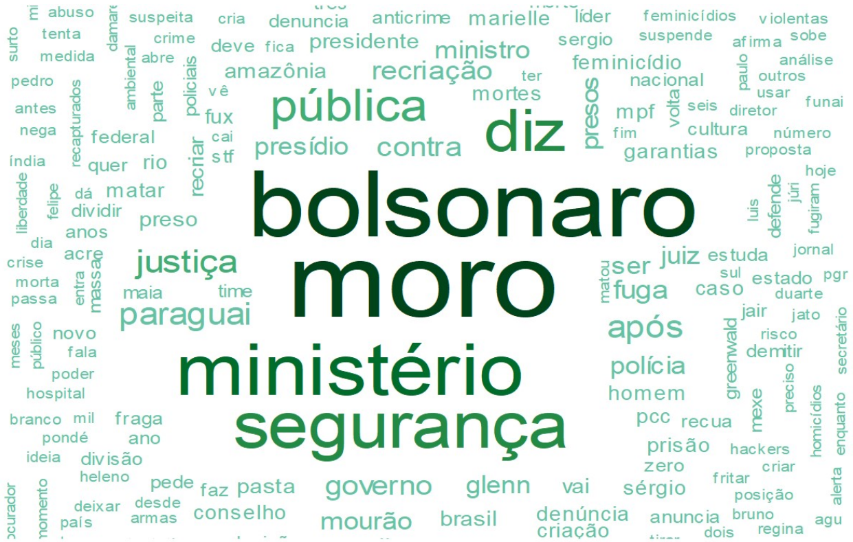
Fonte: Manchetes de notícias a partir de dados de clipagem.

A Lava Jato foi um tópico que surgiu paralelamente aos demais, marcando apenas 12% das matérias sobre segurança pública. Na terça-feira, dia 21/01, o jornalista Glenn Greenwald, do The Intercept Brasil, foi denunciado pelo Ministério Público Federal por interceptação de comunicações, invasão de dispositivo informático e associação criminosa. Segundo o MPF, Glenn teria orientado a ação dos hackers na interceptação de conversas entre o ex-juiz Sergio Moro e os procuradores da Lava Jato. As mensagens vazadas deram origem a uma série de reportagens que ficaram conhecidas como Vaza Jato e apontaram irregularidades na Operação.